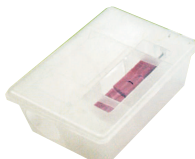
ATR 578 RAT BOX TOTAL Stazione monitoraggio topi total Haccp Per alloggiamento di topicida e/o cartoncino collante. Per roditori di normali dimensioni.